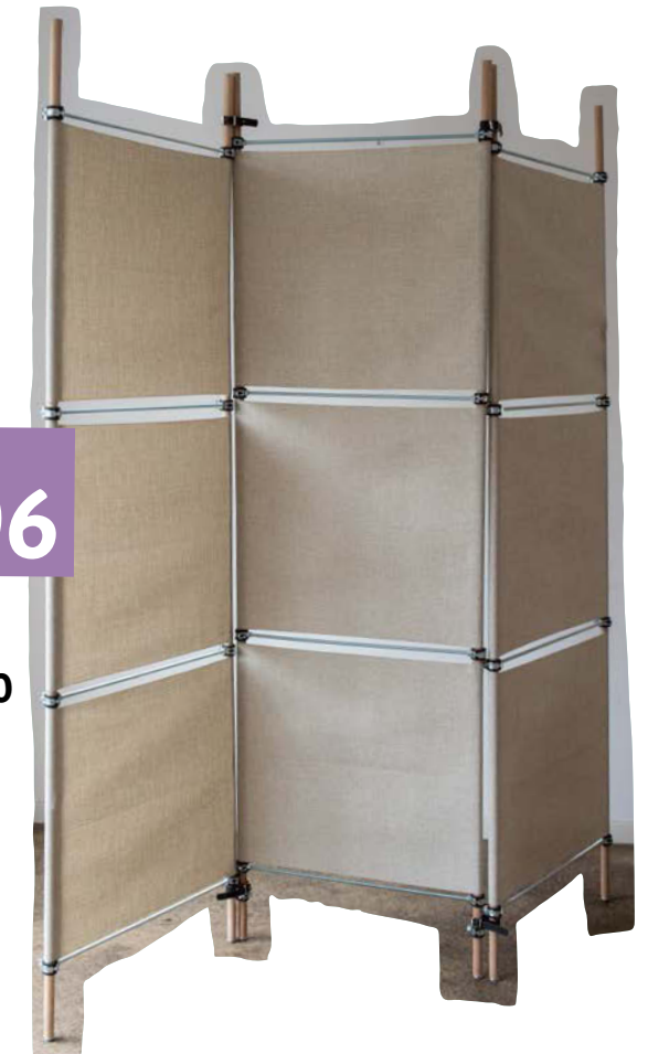
Raumteiler S. 70