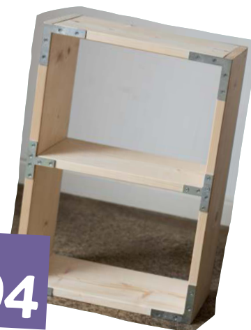
Wandregal S. 54