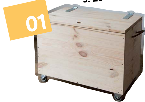
Spielzeugkiste S. 26