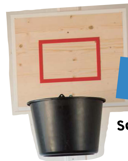
Sockenbasketball S. 78