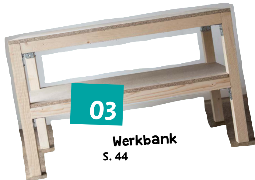
Werkbank S. 44