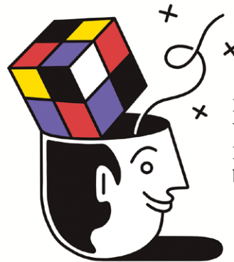
Futter fürs Hirn, Versenkung statt Hektik: Warum Spiele boomen Seite 68