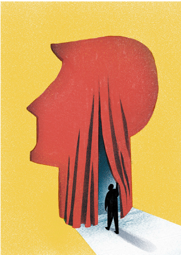
Den Vorhang lüften: Wie es gelingt, sich anderen zu öffnen Seite 12