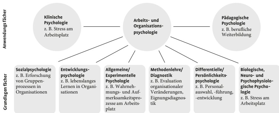
Abbildung 1.2 Interdisziplinäre Vernetzung der Arbeits- und Organisationspsychologie. Die Arbeits- und Organisationspsychologie hat als eines der drei psychologischen Anwendungsfächer sowohl zu den anderen Anwendungsfächern (Klinische und Pädagogische Psychologie) als auch zu psychologischen Grundlagenfächern enge Bezüge

Berufsfeld von Arbeits- und Organisationspsychologen. Seit den 1980er Jahren nimmt die Bedeutung der Arbeits- und Organisationspsychologie als praktisches Berufsfeld stetig zu. In großen Unternehmen wird heute oftmals der Qualität des Personalmanagements wettbewerbsentscheidende Bedeutung beigemessen (vgl. Kap. 11; Frey, 2004). Eine große Zahl von Arbeits- und Organisationspsychologen ist daher im Bereich der Personalarbeit bzw. des Personalservice, in der Personal-