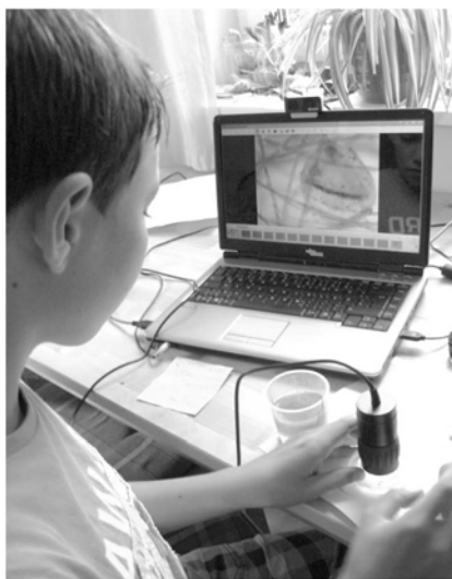
Abbildung 1: Kreative Nutzung des PC-Handmikroskops

Weitere interessante und kostengünstige Werkzeuge zum Experimentieren und Lernen sind digitale Endoskope oder Mikroskope. Beim Endoskop (z. B. von Pancellent ) handelt es sich um eine kleine digitale Kamera, die an einem drahtähnlichen Schlangenkabel befestigt ist und mit einem Smartphone oder Laptop verbunden werden kann. Mit einem solchen wasserfesten Endoskop können Kinder verborgene Dinge erkunden. Neben Unterwasseraufnahmen ist auch die Erfor-