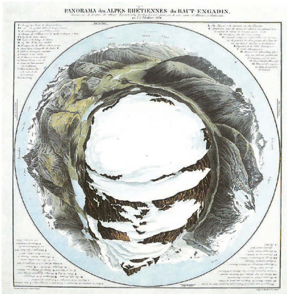
Abbildung 1: Elias Emanuel Schaffner: Panorama des Alpes Rhétiennes, 1836

als Akteur vorweg eine spezifische, auf den folgenden Selbstgenuss durch Sehgenuss hin angelegte Handlungsästhetik vor.