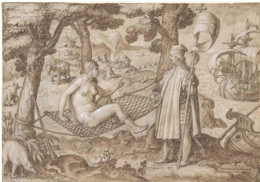
Abb. 1: Jan van der Straet: America (ca. 1587/1589), Original im The Metropolitan Museum of Art, New York

Machtverhältnissen. Sehr deutlich wird dies anhand eines zeitgenössischen Stichs des niederländischen Malers Jan van der Straet (auch: Stradanus 1523–1605), der die Ankunft Amerigo Vespuccis in Amerika darstellt.